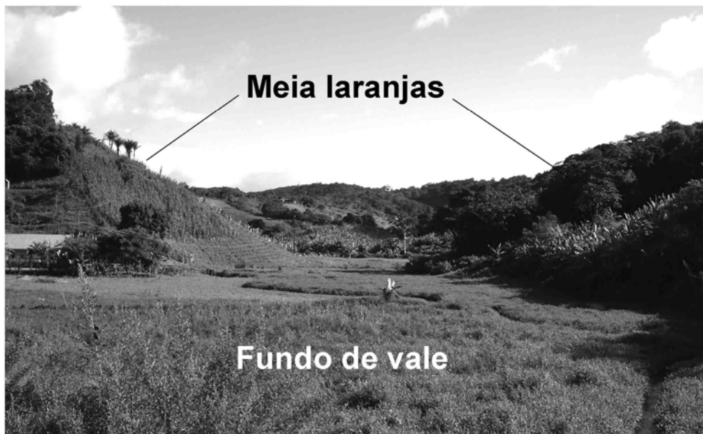
Figura 2 – A: Fundo de vale plano, com uma centena de metros de largura, entre as vertentes em meias-laranjas que se apresentam ocupadas por cultivos recentes de bananeiras em terraços, entre Mulungu e Aratuba (maciço de Baturité, Ceará). Observar o ângulo de concordância brutal entre as vertentes das colinas convexas e os fundos de vales planos, e a ausência de dissecação por escoamentos concentrados no fundo de vale.

bioclimático, pois os fundos de vale planos não têm nada de um pedimento. Se o termo pode não convir, ele pelo menos sugere um processo de evolução geomorfológica comandada por um recuo das vertentes íngremes das meias-laranjas, paralelas à elas mesmas. Esse tipo de evolução lembra claramente os processos de redução de meias-laranjas descritos na Índia, onde os fundos de vales planos se alargam correlativamente até atingir larguras superiores a 1 km, em um contexto bioclimático, litológico e morfotectônico similar (Gunnell e Bourgeon, 1997). Em um clima úmido, a retirada de material do sopé da vertente pelas variações sazonais do lençol freático é com efeito susceptível de garantir o solapamento lateral das vertentes das colinas convexas e a exportação dos detritos finos em direção às áreas rebaixadas adjacentes, formando os fundos de vales.